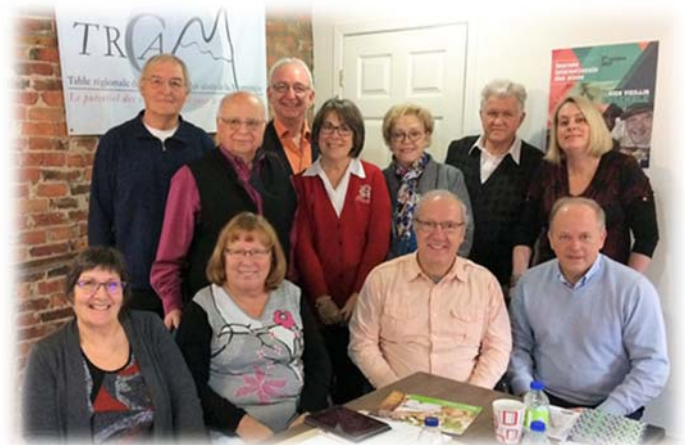
Les membres du CRC, présents à la rencontre de 8 décembre 2017

besoins des aînés de la Montérégie. Les thèmes prioritaires identifiés ont été la situation économique des aînés incluant la fiscalité, la bientraitance/maltraitance, les milieux de vie (habitation et transport) ainsi que le discours âgiste dans les médias. Des groupes de travail approfondiront ces dossiers et une stratégie de prise de parole sera élaborée pour que les aînés puissent prendre la place qui leur revient dans l'espace public. Les collaborations de nouveaux participants sont les bienvenues pour alimenter les groupes thématiques de travail. Si vous ou votre organisation avez développé un point de vue ou une expertise sur l'un des thèmes vous pouvez vous manifester auprès de la coordonnatrice par courriel info@trcam.ca .